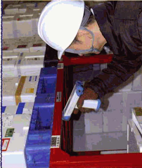
入庫はフリーローケーションで行われ、欄番号をスキヤナで読み取る。

されています。2階の荷造り場では、ホストコンピュータからの出荷指示で出庫された商品の数量確認と梱包を行い、送り状・荷札・梱包明細を入力します。送り状は大手運送会社さまとデータ連携を行い、ロジナビシステムで簡単に印刷することができるようシステム化してもらいました。それを出荷用ラベルとしてプリンタから出力し商