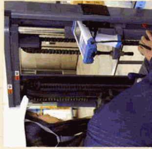
冷蔵庫仕様のハンディターミナル。

されています。2階の荷造り場では、ホストコンピュータからの出荷指示で出庫された商品の数量確認と梱包を行い、送り状・荷札・梱包明細を入力します。送り状は大手運送会社さまとデータ連携を行い、ロジナビシステムで簡単に印刷することができるようシステム化してもらいました。それを出荷用ラベルとしてプリンタから出力し商