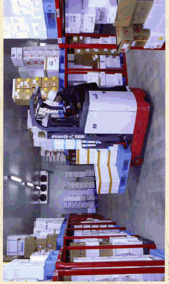
入荷検品後、プラッターで適正なロケーションに商品を入庫する。

どれだけあるのかという情報共有が社員間でできておらず、経験やカンに頼った管理しかできなかったのが、一番の問題点でした。また個々の荷物に貼る伝票の情報も、その都度一枚ずつ人手で打ち込むなど、事務処理も複雑でした。新物流センターでは、適正な人材活用と在庫管理で、業務の効率化を進めていくということだったのでロジナビを導入したのです。