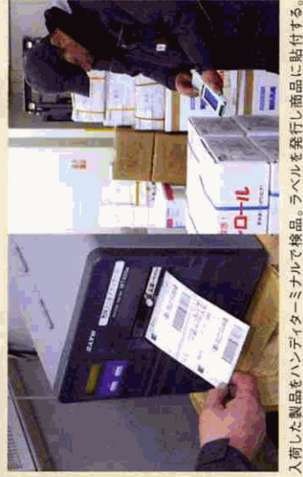
入荷した製品をハンディターミナルで検品。ラベルを発行し商品に貼付する。

当社の1日の入出荷は400〜500ケースほど。ロジナビ導入以前は、多くの商品の煩雑