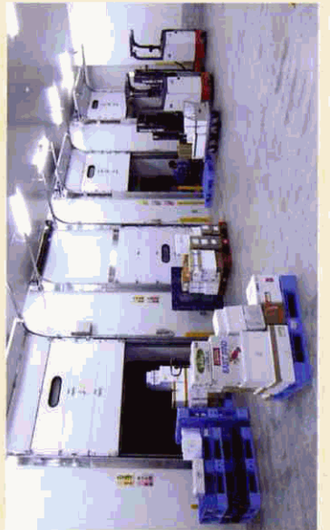
納品書が添付されるのを持って出荷される商品。

はコストパフォーマンスが良かったのと、我々現場の話を聞き、業務上必要なことや便利なことを詳細にわたり提案してくださったからです。トラブルで業務へ支障をきたさないように、念のため予備のサーバを置き、常時はリモートメンテナンスでオンラインでの作