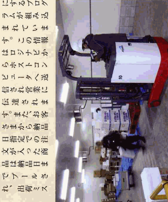
出荷品は荷造り場で確認作業・梱包を行い、データの入力を行う。

ニチユさんには20年以上も前からフォークリフトを入れてもらっているという話を聞いています。移転時にはロジナビの他に、ネステナーとプラッター15台も導入しました。ニチユさんのロジナビを採用したの